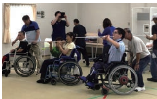
吹き矢体験会 <あかびら共生ネットワーク>