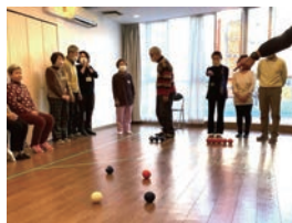
ポッチャを体験。またやりたい!との声多数 <実家なんとかし隊>