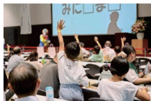
里親研究大会でクイズに答える子供たち 特定非営利活動法人 <名古屋市里親会こどもピース>