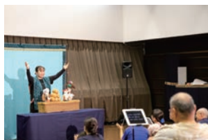
字幕タブレットでの人形劇 NPO法人 <アートワークショップすんぷちよ>