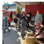
外国ルーツの生徒による餅つき 特定非営利活動法人 <アレッセ高岡>