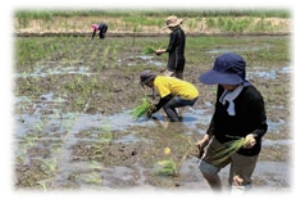
自分達の手でお米作りに挑戦中 <全国農福学連携推進協議会>