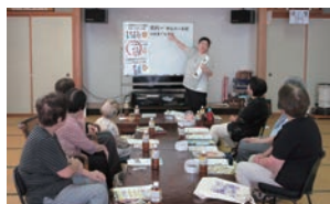
高齢者向けトラブル防止出前講座 特定非営利活動法人 <消費者支援ネットワークいしかわ>