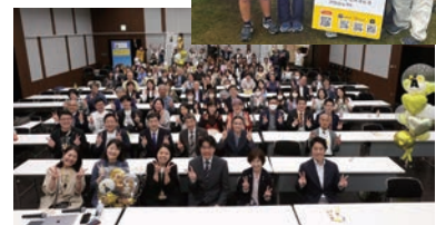
こどもホスピスをもっと知って応援しよう!シンポジウム 認定特定非営利活動法人 <愛知こどもホスピスプロジェクト>