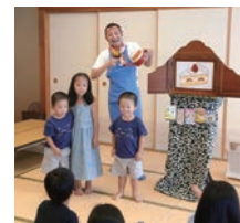
紙しばいイベント <日本語教室「こんぱす」>