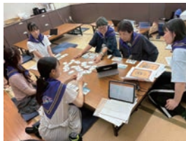
難聴会員と音声認識アプリを使ってコミュニケーション <特定非営利活動法人 こえもじ>