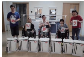
助成した防災セットの前で <特定非営利活動法人 はあと>

購入直後にM8.8の巨大地震による津波避難警報が発令され、実際に使用することになりました。中でもエアーマットの評判が良かったと報告を頂きました。