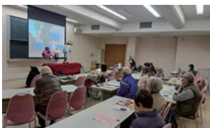
パーキンソン病を学ぶ人形劇 特定非営利活動法人 <てんびん>