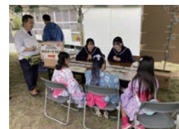
防災ポーチづくり 特定非営利活動法人 <まちづくりスポット仙台>