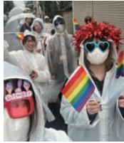
LGBTQパレード <Festival The Rainbow実行委員会>