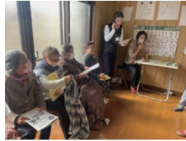
怪しい電話に注意 <えがわさんち>