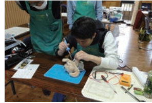
出張診療中 <おもちゃ病院ぺんぎん>